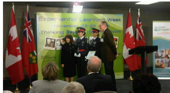
Remise de l'un des Prix champion des employeurs à la Police d'Ottawa, le 23 novembre 2010

Le 23 novembre, le ROPE s'est associé aux quatre conseils scolaires pour organiser le Déjeuner connexions de 2010. Cet événement a été l'occasion de célébrer la Semaine de l'apprentissage par l'expérience, et de remettre le Prix champion des employeurs 2010 à l'entreprise Les traiteurs Bytown. Des prix de reconnaissance ont également été remis à des employeurs qui ont fait preuve de dévouement pour offrir aux élèves du secondaire une expérience enrichissante en milieu de travail - signalons notamment DP Electric, Abbot Point of Care et de la Police d'Ottawa.