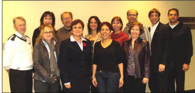
Les membres de la Coalition contre la toxicomanie chez les élèves d'Ottawa